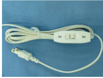
中間スイッチ付電源コード